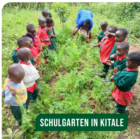
SCHULGARTEN IN KITALE

Daneben wurden gemäß Stiftungszweck der Archibald William Milburn Stiftung landwirtschaftliche Projekte der GLS Zukunftsstiftung Entwicklung bedacht, ebenso wie der Verein zur Förderung von Lehre und Forschung in der Anthroposophischen Medizin e.V. Die Organisation wurde 2023 gegründet und ist Förderverein für das Begleitstudium Anthroposophische Medizin an der Universität Witten/Herdecke, für das die Förderung bestimmt war.