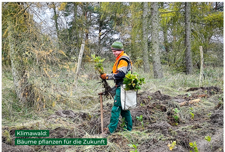
Klimawald: Bäume pflanzen für die Zukunft

Seit dem Jahr 2023 entsteht deshalb mithilfe der BioHöfe Stiftung, der BioBoden Genossenschaft und der GLS Bank ein Wald des Wandels, der sogenannte „Klimawald“. Im Landkreis Havelland westlich von Berlin wird auf einer ein Hektar großen Fläche Neues gewagt: Dort werden auf einer durch die BioBoden