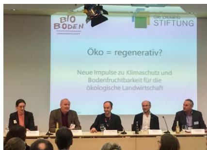
Vorstellung neuer Initiativen zur regenerativen Landwirtschaft

Wir finden: Ein sinnvoller Weg, den wir gerne fördern.