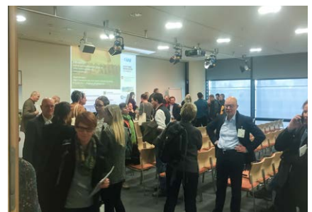
Lebhafte Diskussionen auch nach der Veranstaltung

Weitere Informationen zum Forschungsprojekt sowie ein Video finden Sie auf unserer Website: www.biohoeft-stiftung.de